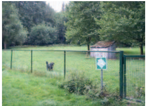
Bois de Dieleghe