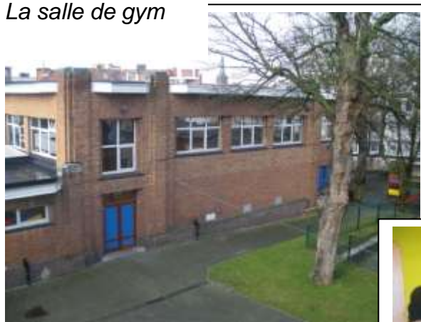
La salle de gym