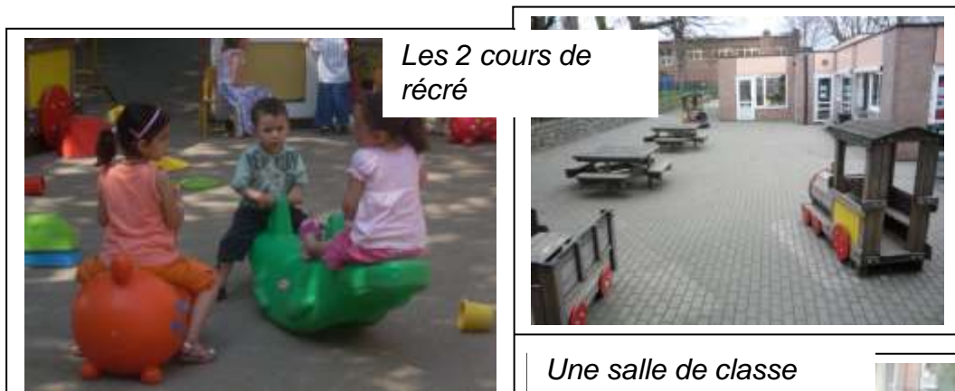
Les 2 cours de récré

Les élèves bénéficient de 2 petites cours de récréation dont une propose une plaine de jeux, de sanitaires adaptés, d'un local de gymnastique adapté à leurs besoins et d'un espace dans la bibliothèque leur proposant des livres adaptés à leur âge.