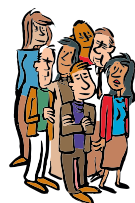
Les conseillers communaux