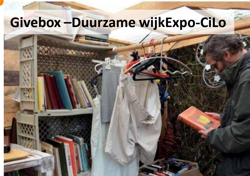
Givebox –Duurzame wijkExpo-CiLo