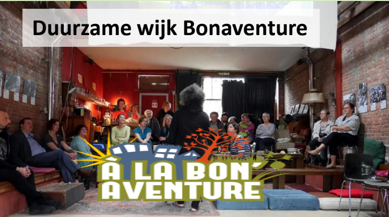
Duurzame wijk Bonaventure