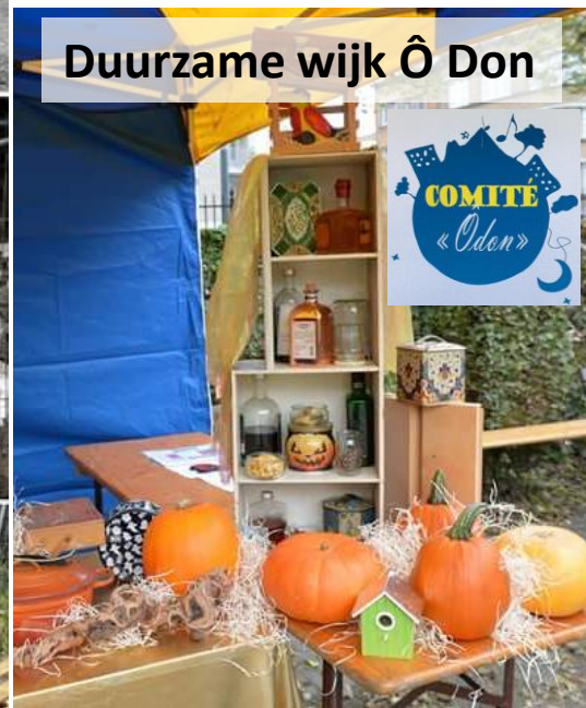
Duurzame wijk Ô Don