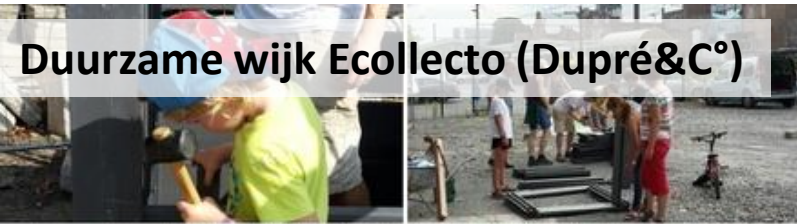
Duurzame wijk Ecollecto (Dupré&C°)