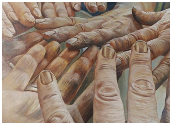
2 de prijs: Luc Dechamps 'De vuile handen'