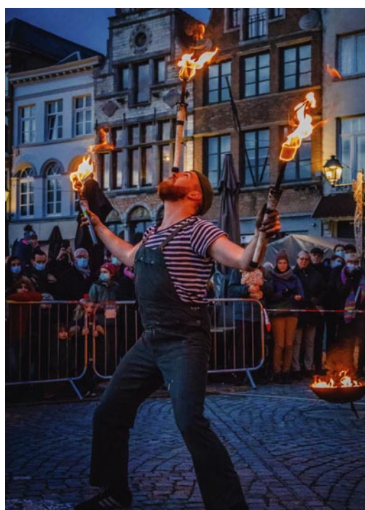
Lucifer's Party

Wat is de warmste afspraak van het jaar? Dat is ongetwijfeld Wintervoenk. Van zodra de avond valt, kan je op het Kardinaal Mercierplein genieten van vuurshows, acrobatie en animatie. De ideale avond voor jong en oud, om de eindejaarsperiode goed in te zetten.