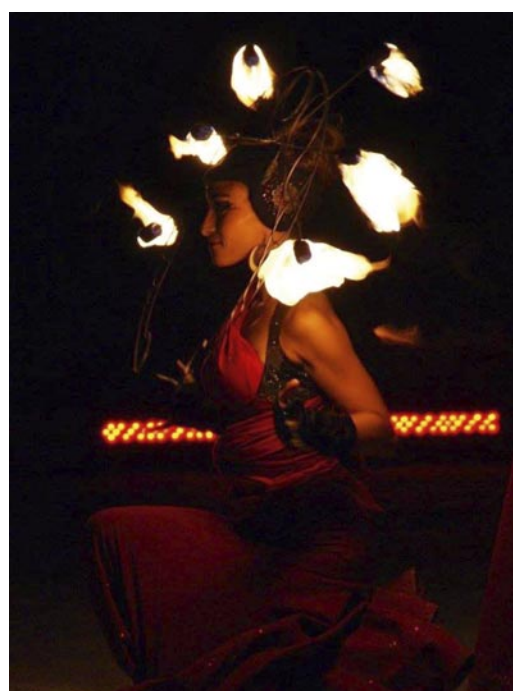
Anima © Géraldine Tranchecoste

'Anima, de stem van de vlammen' heeft heel wat invloeden. De arabesken van Art Nouveau, de stemmen van traditionele Mongoolse liederen, een angstaanjagend Haka-ritueel, een meeslepende tango of een opera-aria. Met de glimlach beheersen de artiesten de vlammen, elegant uitgedost in glinsterende kostuums. Anima is een hymne aan het vuur, fonkelend, dansend en knetterend.