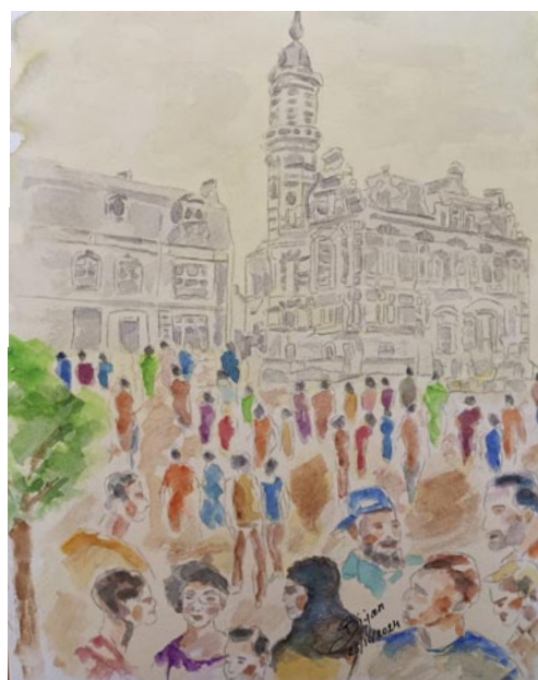
3 de prijs: Ghalamkaripour Bijan 'Jette anno 1930'