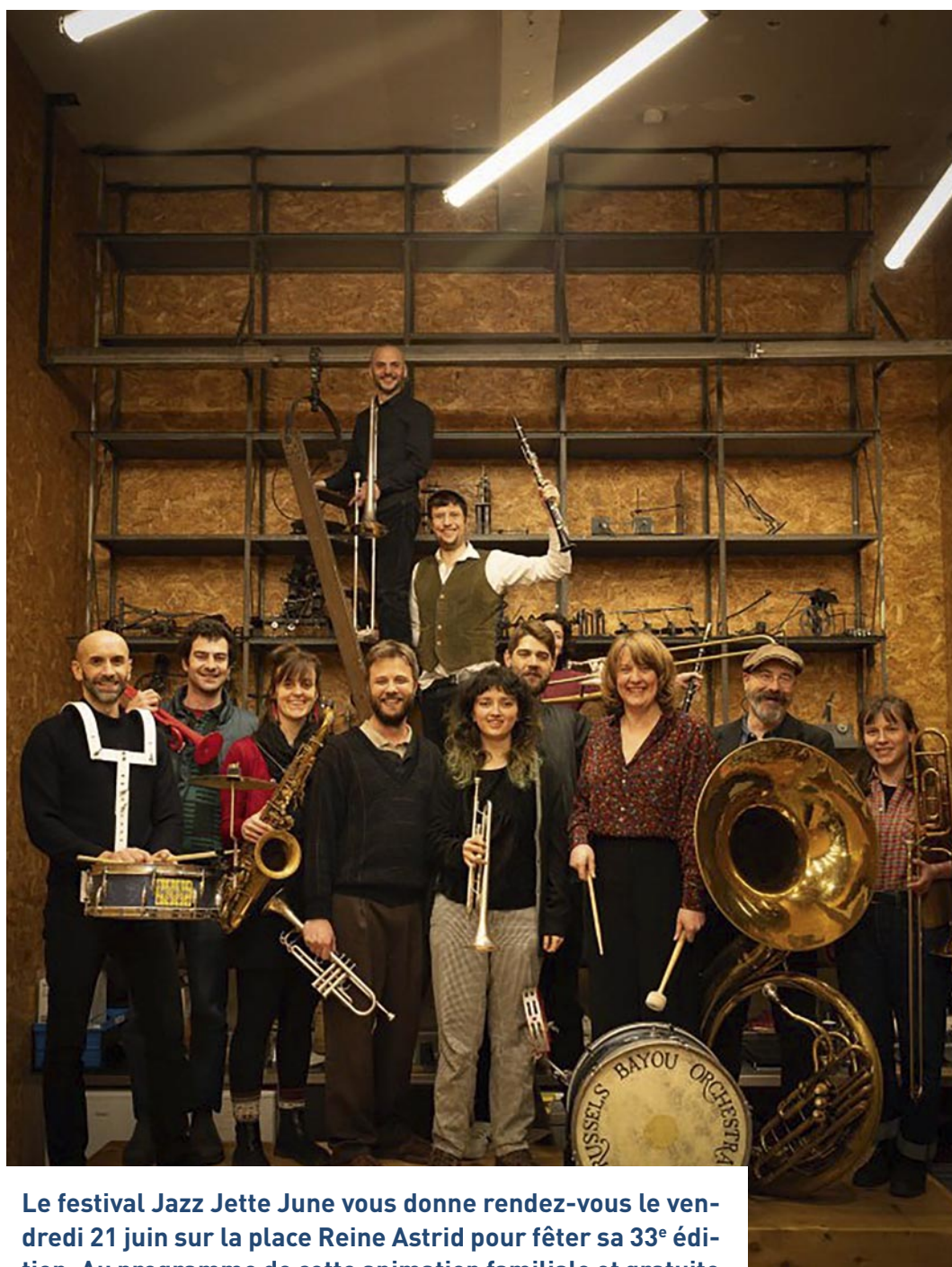
Brussels Bayou Orchestra

Le festival Jazz Jette June vous donne rendez-vous le vendredi 21 juin sur la place Reine Astrid pour fêter sa 33 e édition. Au programme de cette animation familiale et gratuite orchestrée par le Centre culturel de Jette : des coups de cœur jazz pour s'ambiancer et fêter l'arrivée de l'été.