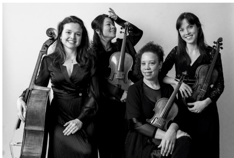
GoYa Quartet

L'Ensemble Clematis se distingue des autres ensembles par son choix pour la musique baroque. Avec deux violons et une basse continue, l'Ensemble Clematis interprétera à l'Abbaye des sonates en trio de Cavalli et Vivaldi. Préparez-vous à un voyage dans le temps vers le dix-septième siècle.